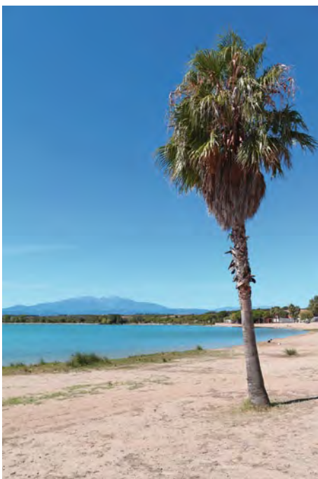
Lac de la Raho

Au cœur du lotissement neuf de l'Oratori, majoritairement pavillonnaire, Via Bella bénéficie d'un environnement privilégié. Intimiste et idéalement située à deux minutes des commerces et des équipements, cette résidence permet de concilier tranquillité et vie pratique. Le charme bucolique des vergers ou la proximité à pied de l'école Marcel Pagnol feront la joie des résidents à la recherche d'une vraie qualité de vie.