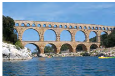
Pont du Gard