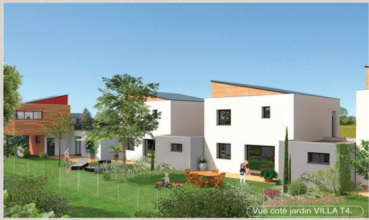
Vue coté jardin VILLA T4.