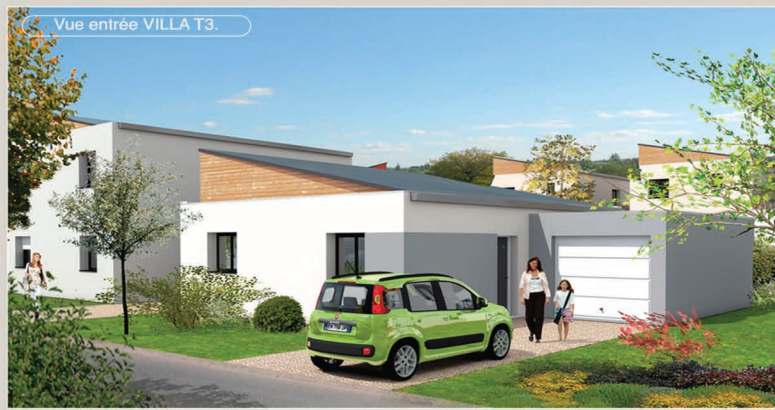
Vue entrée VILLA T3.