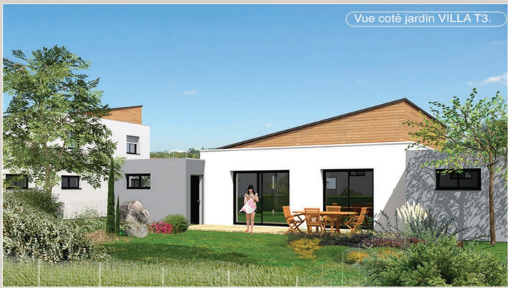
Vue coté jardin VILLA T3.

Le nouveau quartier LA CROUZETTE sera assurément un lieu où l'on se sentira bien, dans une ambiance oscillant entre ville et nature.