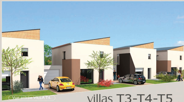
Vue entrée VILLA T4.