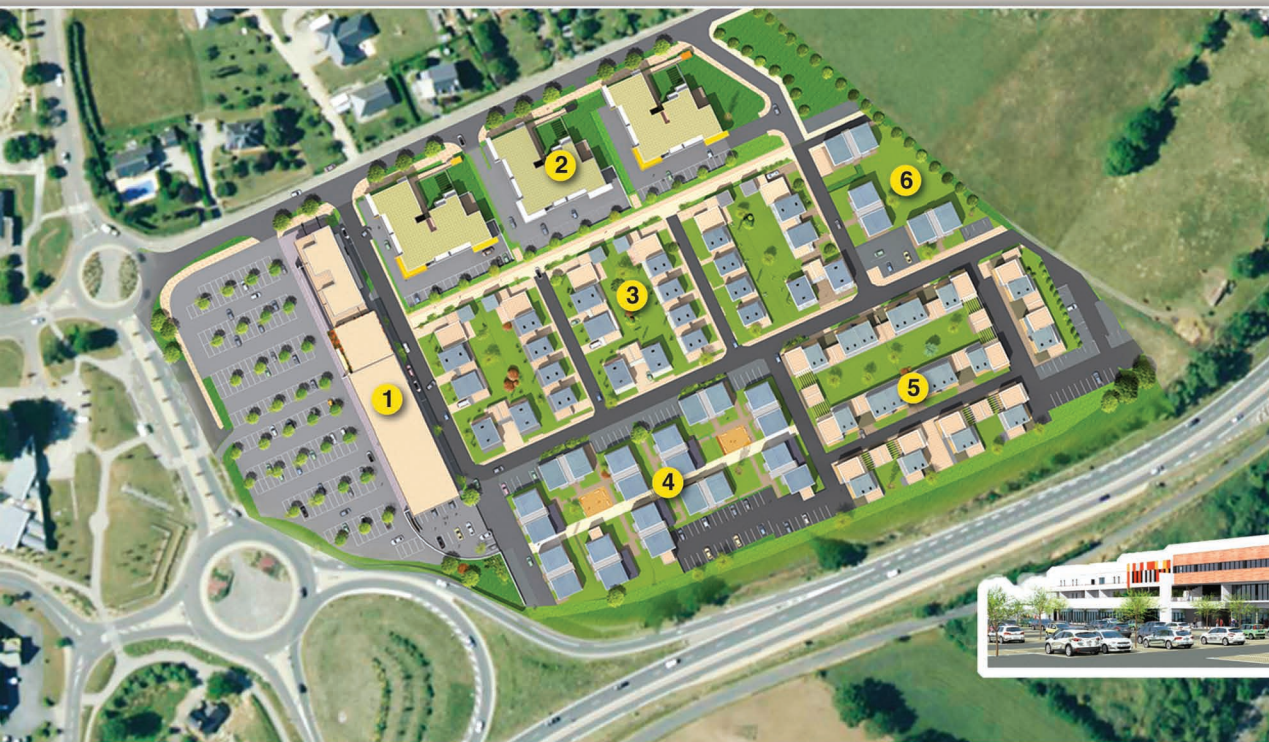
Plan de masse du Quartier LA CROUZETTE.